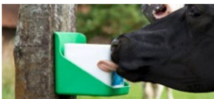
STANDARD | algemeen

Wetenschappelijk onderzoek laat zien dat toevoeging van 70 gram extra zout aan het rantsoen de urineproductie met gemiddeld 23% verhoogt. Dat gebeurt niet met likstenen. Dan neemt de koe namelijk alleen de hoeveelheid zout die nodig is en nooit te veel. Zo hoeft de koe ook niet te compenseren voor extra zout door meer water te drinken.