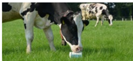
ELEMENTS PLUS | grazend vee