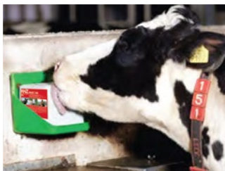
BASIC 100 reines Siedesalz

Die Natur hat die Lösung! Solange eine Kuh Zugang zu Salz hat, wird sie instinktiv nur die Menge zu sich nehmen, die sie benötigt. Indem Sie Ihrer Herde hochwertige KNZ® Salzlecksteine bereitstellen, ermöglichen Sie Ihren Tieren freien Salz-Zugang. Darüber hinaus enthalten KNZ Salzlecksteine weder künstliche Farb-, Geschmacks- oder Süßstoffe, noch zugesetzte Aromen. Auf diese Weise werden Kühe nicht zum fressen animiert und konsumieren nur so viel sie benötigen.