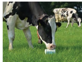
ELEMENTS PLUS für Weidevieh