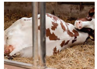
FERTILITY fördert die Fruchtbarkeit