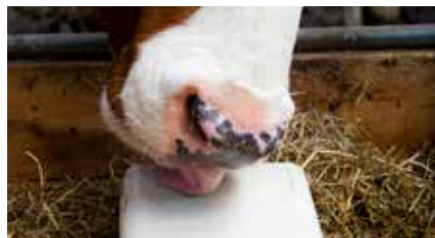
UNIVERSAL MULTI extra Eisen

KNZ® BIOTIN beugt Klauenkrankheiten vor und verbessert das Wohlbefinden sowie die Milchleistung.