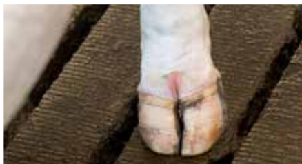
BIOTIN für gesunde Klauen