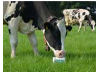
ELEMENTS PLUS für Weidevieh