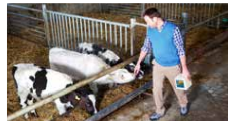
JUNIOR für Jungvieh

KNZ® UNIVERSAL MULTI ist mit Eisen angereichert. Die richtige Wahl für Tiere, die einen erhöhten Eisenbedarf haben.