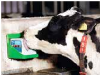
BASIC 100 reines Siedesalz

Die Natur hat die Lösung! Solange eine Kuh Zugang zu Salz hat, wird sie instinktiv nur die Menge zu sich nehmen, die sie benötigt. Indem Sie Ihrer Herde hochwertige KNZ® Salzlecksteine bereitstellen, ermöglichen Sie Ihren Tieren freien Salz-Zugang. Darüber hinaus enthalten KNZ Salzlecksteine weder künstliche Farb-, Geschmacks- oder Süßstoffe, noch zugesetzte Aromen. Auf diese Weise werden Kühe nicht zum fressen animiert und konsumieren nur so viel sie benötigen.