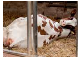
FERTILITY fördert die Fruchtbarkeit